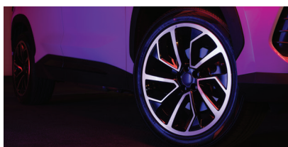
» Roda de liga leve 20"