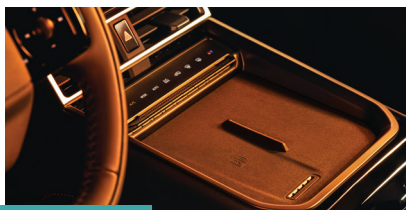
» Carregador indutivo de 50W