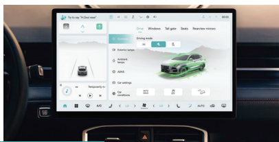
» Tela multimídia touchscreen de 15,6"