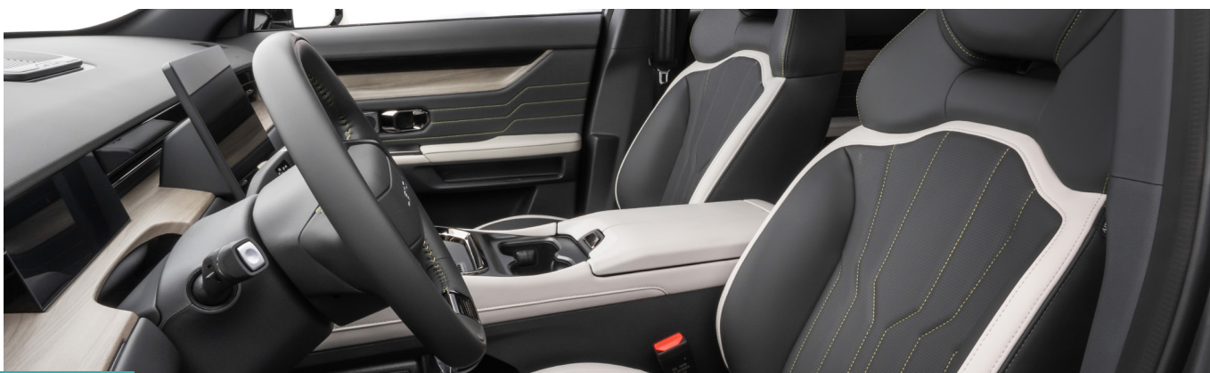
Cinza e Creme