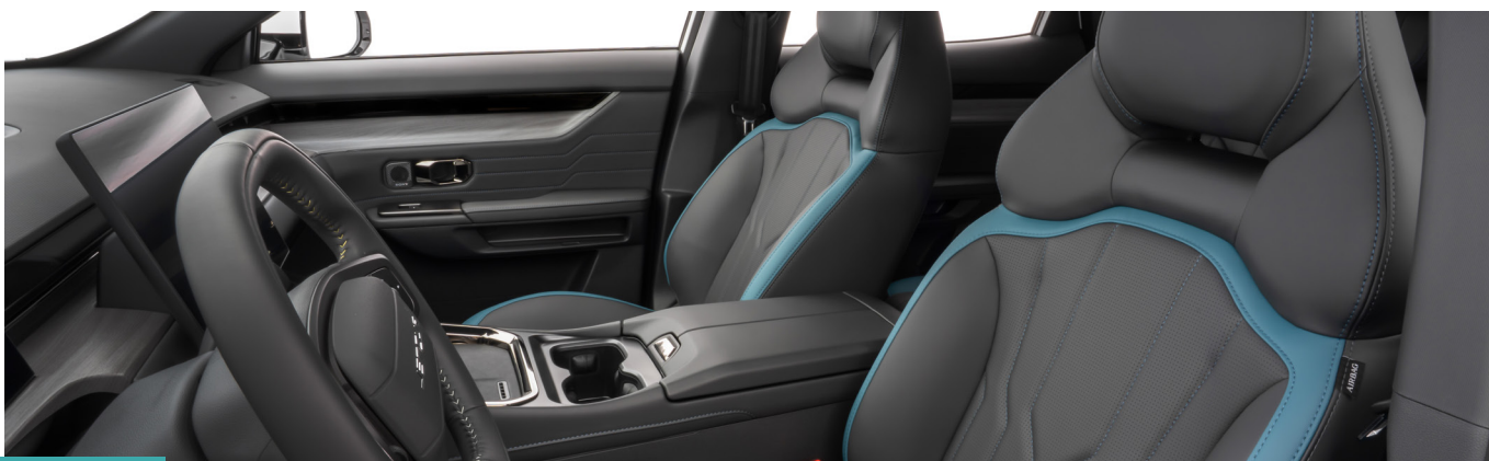
Cinza e Azul