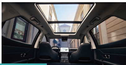
» Teto Solar panorâmico