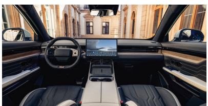
» Ar-condicionado Dual Zone