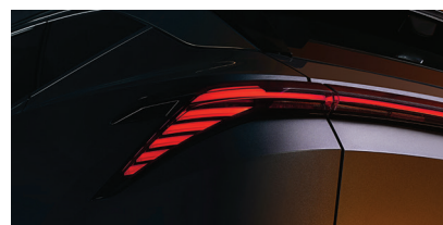
» Lanternas conectadas em led