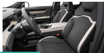
» Banco aquecidos e ventilados