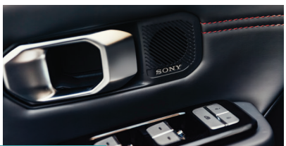
» Sistema de som Sony com 9 alto-falantes