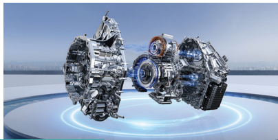
» Transmissão híbrida inteligente de 3 velocidades