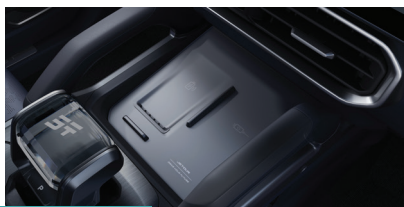
» Carregamento rápido sem fio de celular de 50W