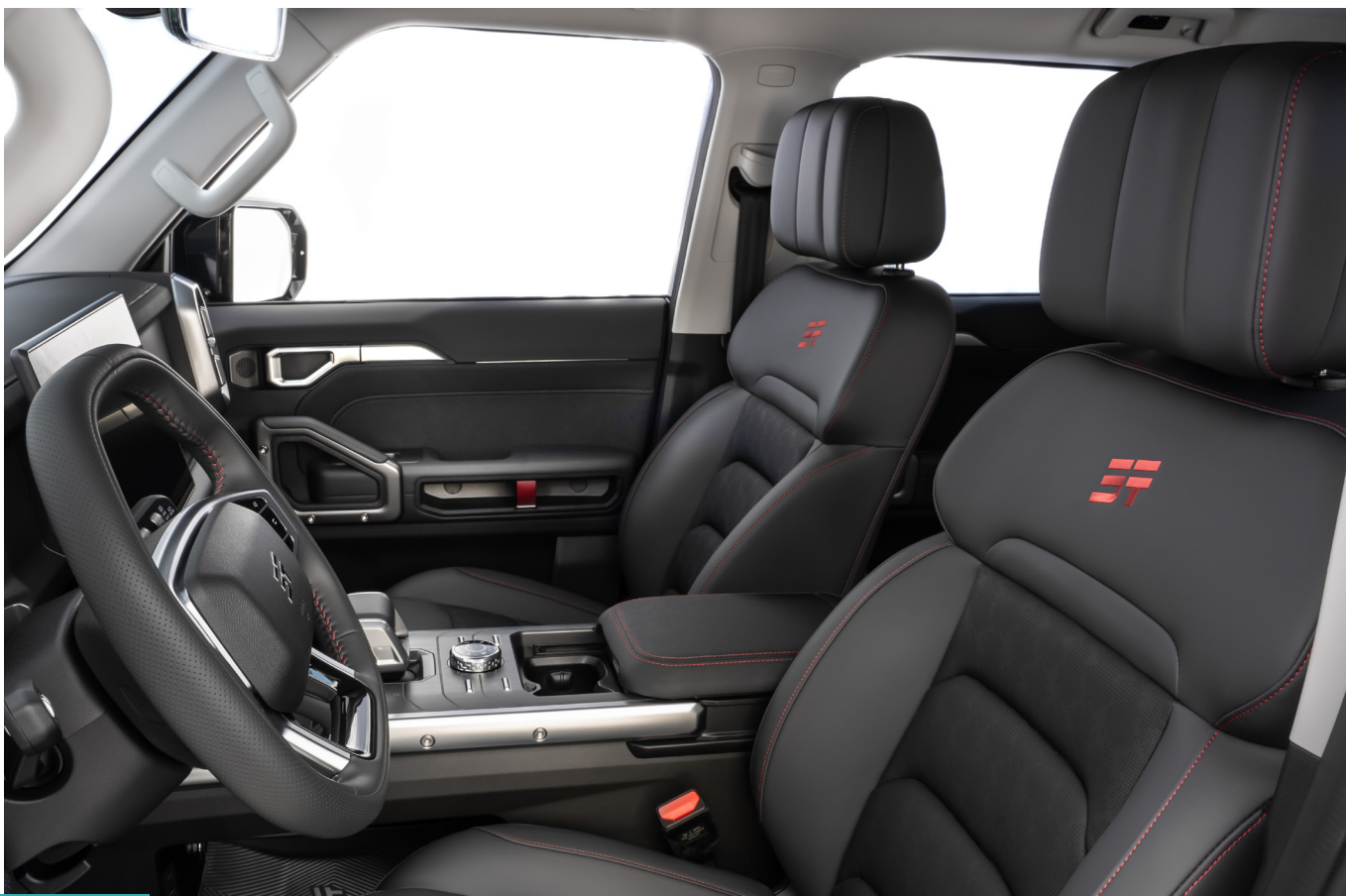
Preto e Vermelho