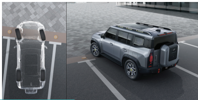
» Imagem panorâmica 540°