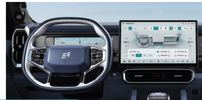
» Tela multimídia touchscreen de 15,6"