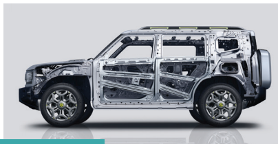
» Design robusto e estrutura reforçada