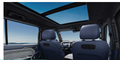
» Teto Solar Panorâmico