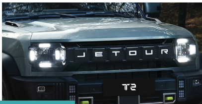
» Faróis Matrix