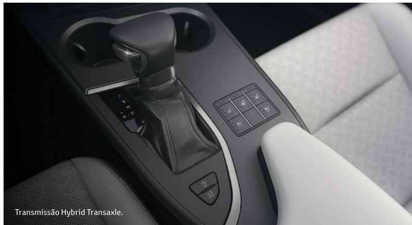
Transmissão Hybrid Transaxle.