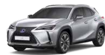
UX 250h DYNAMIC