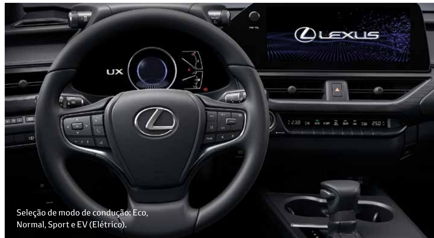
Seleção de modo de condução: Eco, Normal, Sport e EV (Elétrico).