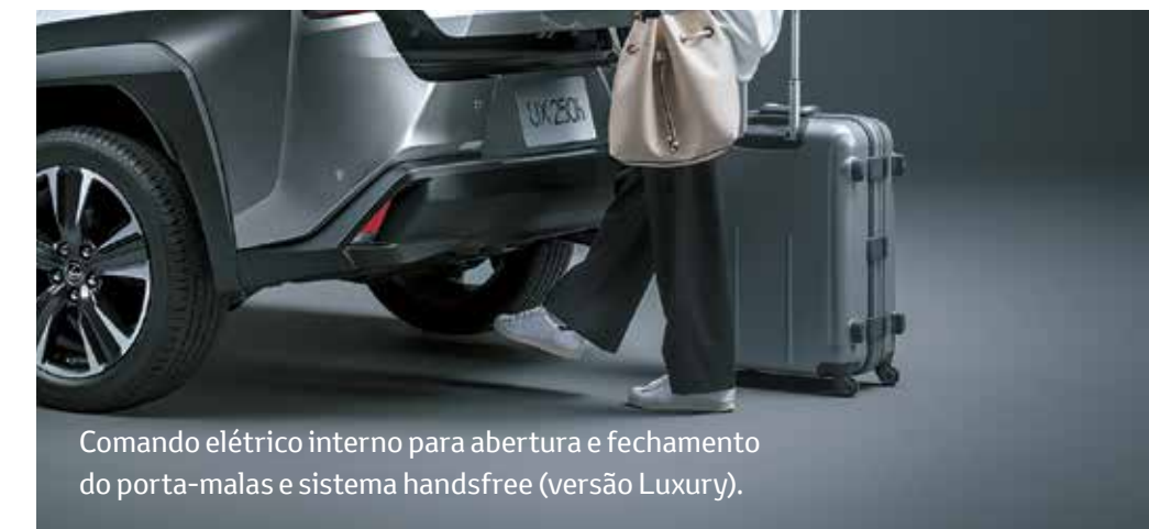
Comando elétrico interno para abertura e fechamento do porta-malas e sistema handsfree (versão Luxury).