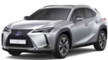
UX 250h LUXURY