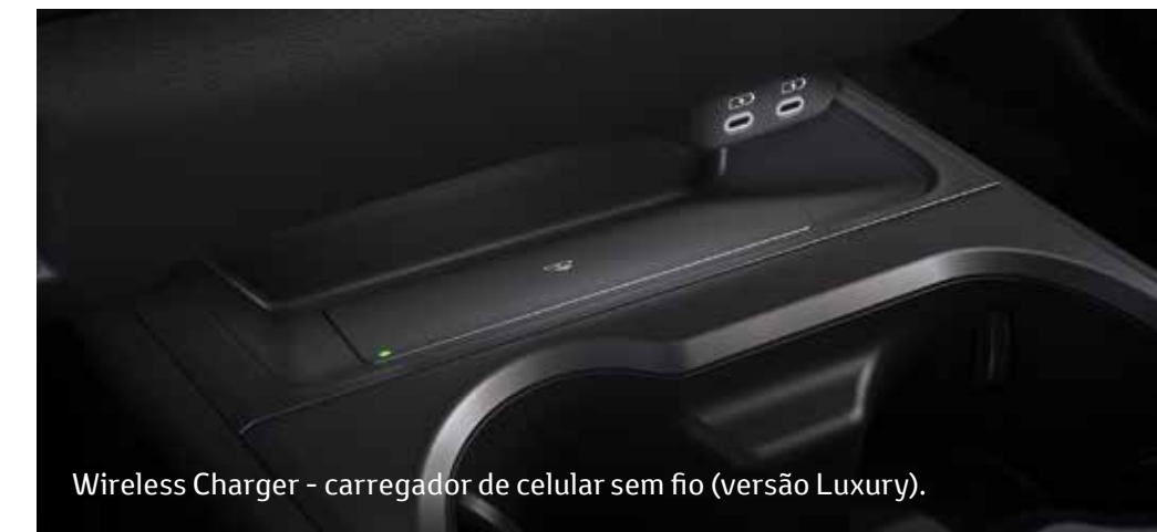
Wireless Charger - carregador de celular sem fio (versão Luxury).

O sistema Smart Entry detecta a chave por aproximação e destrava o veículo. Para os que gostam de inovação, o UX oferece itens de tecnologia como o carregador de celular sem fio e o sistema multimídia com tela LCD 2 de 12,3" (versão Luxury) e 8"(versão Dynamic), sistema de navegação GPS 3 , sistemas de conectividade Apple CarPlay® e Android Auto®, câmera com visão 360°, Bluetooth®.